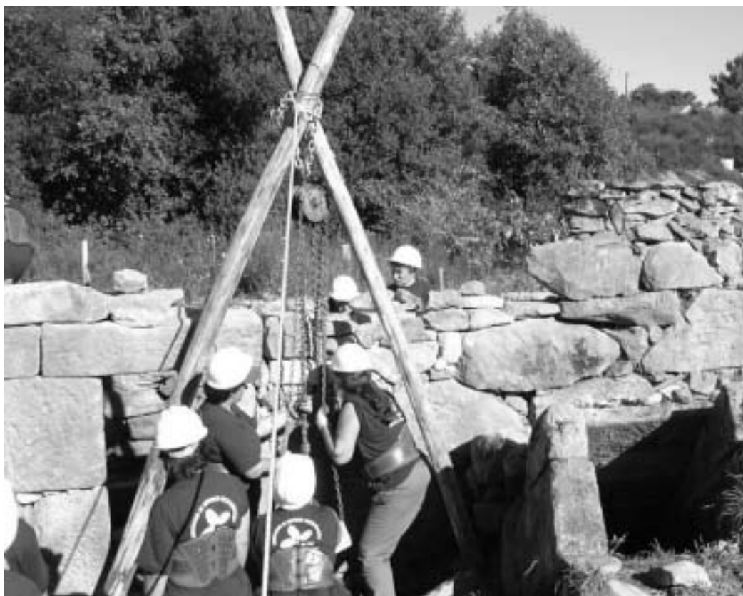
Alumnas-traballadoras do O.E. "Restauración de Tui"

Tres monitores do obradoiro de emprego "Restauración de Tui", que conta con 29 alumnas - traballadoras e tan so un alumno - traballador, describen a súa experiencia na formación e no traballo diario con mulleres en especialidades como a albanería, a carpintería ou a cantería, que tradicionalmente son profesións desenvolvidas principalmente por homes. Ó