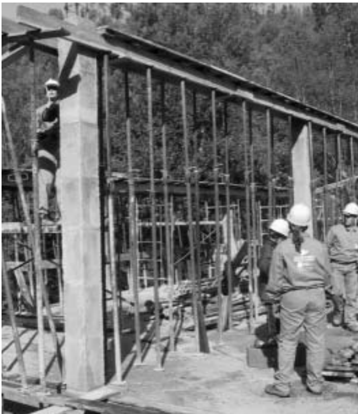
Alumno/as-traballadore/as do O.E. "A Fraga - O Beque"

Pero se se analizan as ofertas das empresas nestes sectores conséntase que demandan profesionais cun perfil que difire bastante do que ten o noso alumnado: o 78% son mulleres, a maioría sen experiencia laboral e se dispón dela é en oficios relacionados coa pesca e derivados, está pouco cualificado, salvo a formación adquirida durante o proxecto e non está especializada.