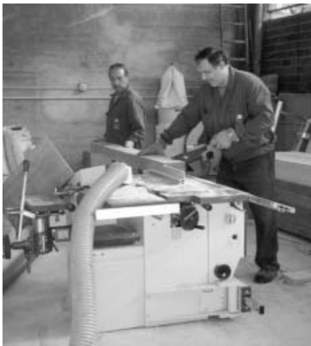
Alumnos-traballadores do O.E. "Covelo-Natura"

Outro aspecto positivo é que se rehabilita un patrimonio común.