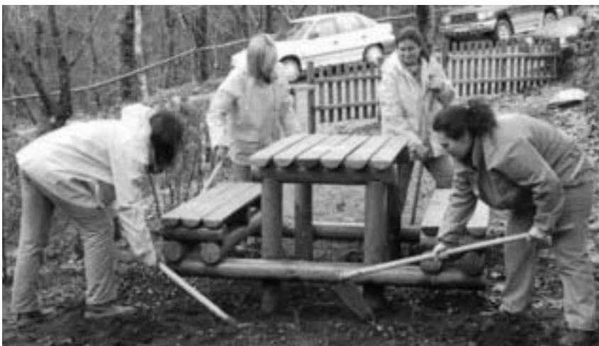
Alumnas-traballadoras do O.E. "A Fraga-O Beque"

■ un segundo, relacionado co sector Servizos, co que se poden vincellar as actividades derivadas da conservación e mantemento de xardinería e ambientes naturais. Neste grupo terían posibilidades de inserción as persoas traballadoras de Forestal.