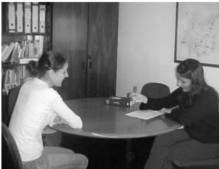
Servicio de Asesoramento a Emprendedores da Mancomunidade de Vigo

rial que se artellan por parte dos distintos organismos e a administración pública ás empresas e ás persoas emprendedoras que os necesitan, de maneira que se facilite o acceso das empresas ós recursos (fontes de información, financiamento allea, subvencións, formación,