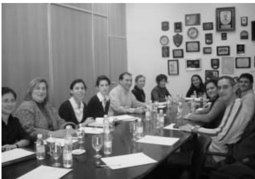
Rede de técnico/as de emprego da Mancomunidade de Vigo

En concreto, na área de Vigo o instrumento de apoio á creación de empresas materialízase a través do Servizo de Asesoramento a Emprendedores, en funcionamento dende o ano 1996, que integra a todos os técnicos/as de emprego e a outros axentes de desenvolvemento dependentes de cada un dos concellos da Mancomunidade da Área Intermunicipal de Vigo que prestan de forma coordinada e conxunta unha serie de servizos co obxecto de facilitar a implantación de empresas neste territorio. Nembargantes, á hora de promocionar novas iniciativas, a supervivencia das empresas de nova creación é un dos aspectos máis preocupantes para todas as entidades que teñen algunha responsabilidade no eido da creación de empresas, xa que existen diversos estudos que poñen de manifesto a elevada taxa de mortalidade das mesmas (as estatísticas consultadas sitúan esta taxa entre un 50% e un 70%) e a dificultade que teñen para superar a barreira dos catro anos de funcionamento e consolidarse.