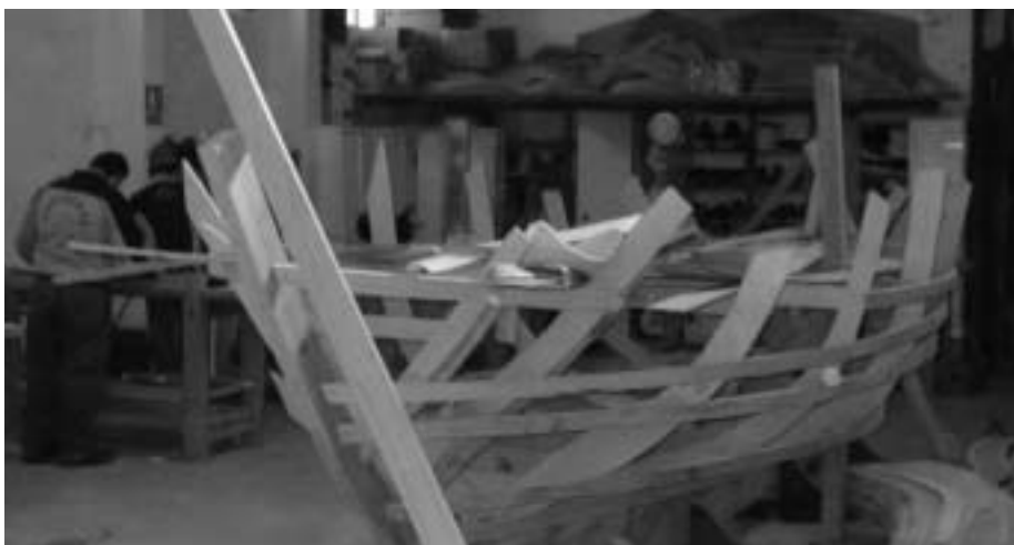
Armazón de barco construído por alumno/as-traballadore/as da E.O. "Mar de Vigo II"

elaboración dos moldes das embarcacións, así como profesionais para a habilitación dos interiores. Nunha palabra, da competencia que amosemos para "vender" as nosas rías coas súas singularidades, os seus variados atractivos, coa posibilidade de navegar a vela case todo o ano, coa súa alta capacidade de acoller amarres e coa súa situación xeográfica de paso e arribada de navegantes (dos 7.000 que pasan polas nosas costas só recalán o 10%), etc., depen-